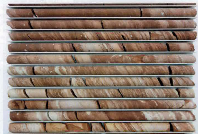
Carlos Irijalba, Stone Reel , 2013. © de l'artiste

CAB Art Center Rue Borrens, 32-34 Bruxelles www.cab.be jusq. 24-06