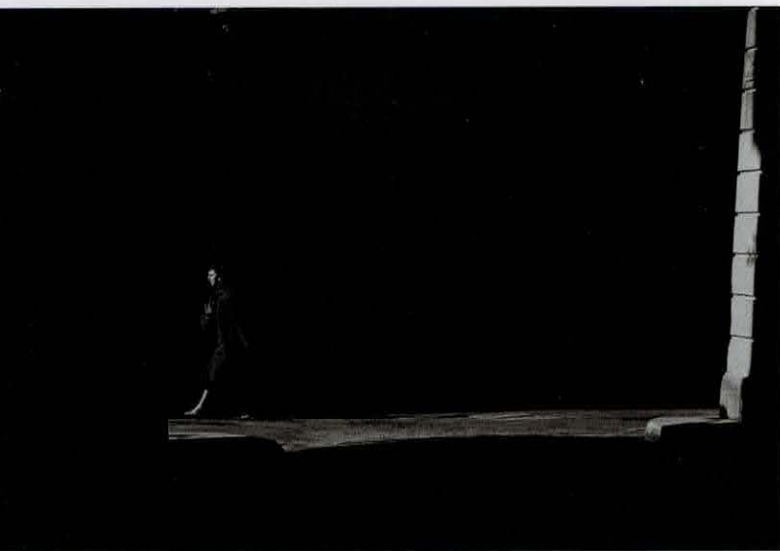
Harry Callahan, France, 1957-1958.