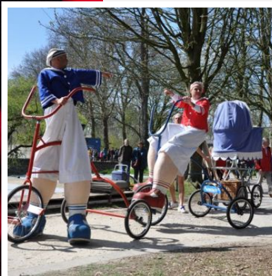
Fadunito uit Spanje gaat op wandel met een reuzenfamilie.

Wat? Parktheaterfestival Wanneer? Op 28 mei, om 11.30 uur picknick, voorstellingen vanaf 14 uur Waar? Prinses Josephine-Charlotterpark, Lokeren Toegangsprijs? Gratis www. lokeren.be/parktheater