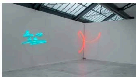
Vue de l'exposition « Shaping Light » à la Fondation CAB.