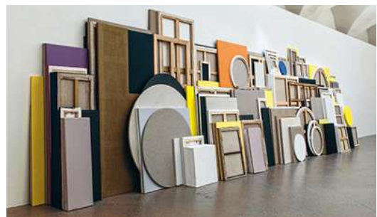
VUE DE L'EXPOSITION PICASSO-RUTAULT, GRAND ÉCART