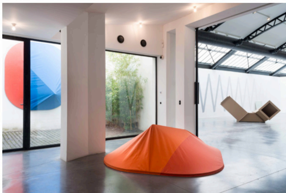
Vue de l'exposition "Figures on a Ground. Perspective on Minimal Art" à la Fondation CAB, Bruxelles.