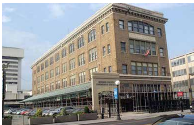
Le bâtiment du futur Centre Pompidou X Jersey City.

L'internationalisation du Centre Pompidou continue à marches forcées. Après l'ouverture des antennes de Malaga (en 2015) et Shanghai (en 2019), qui faisaient suite à la première implantation hors de Paris, à Metz (en 2010), la direction annonçait début juin un nouveau projet américain. C'est près de New York, à Jersey City que s'installera la nouvelle antenne baptisée Centre Pompidou X Jersey City. L'emplacement choisi est un immeuble de briques de 1912, construit à l'époque pour loger la compagnie de gaz et d'électricité. Rénové il y a 25 ans pour y installer des services et la bibliothèque du Hudson Community College, le bâtiment a été racheté par la Ville en 2017 avec l'objectif d'en faire un foyer artistique et culturel. C'est l'agence OMA, et son associé new-yorkais Jason Long, qui sont chargés de sa reconversion, avec une ouverture prévue en 2024.