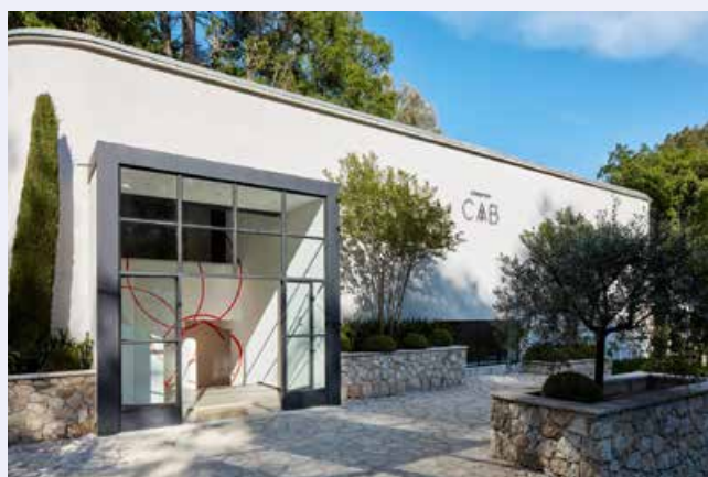
La Fondation CAB.