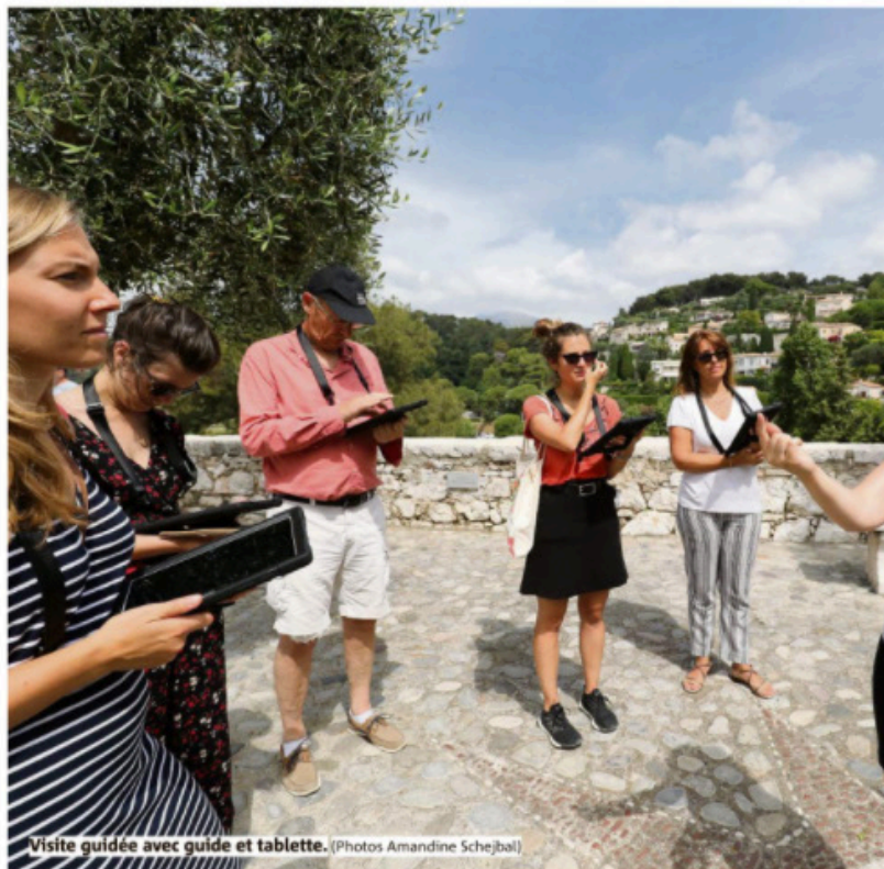
Visite guidée avec guide et tablette.