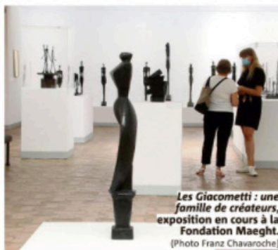
Les Giacometti : une famille de créateurs, exposition en cours à la Fondation Maeght.

> Fondation CAB. Mardi à dimanche (10 h à 18 h, juin-octobre). Tarif : 12 euros, enfant gratuit. Rens. 04.92.11.24.49. www.fondationcab.com