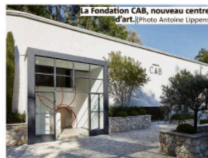
La Fondation CAB, nouveau centre d'art.