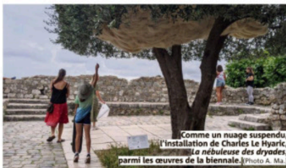
Comme un nuage suspendu, l'installation de Charles Le Hyaric, La nébuleuse des dryades , parmi les œuvres de la biennale.