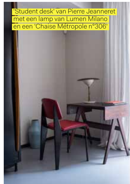
'Student desk' van Pierre Jeanneret met een lamp van Lumen Milano en een 'Chaise Métropole n°306'