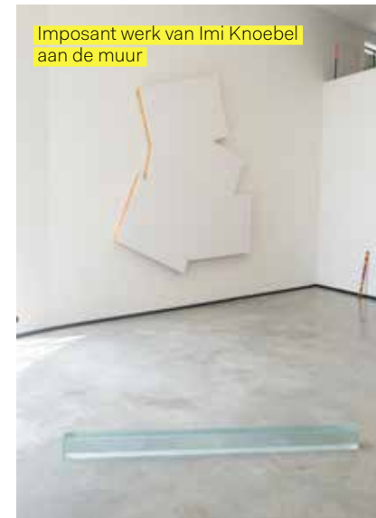
Imposant werk van Imi Knoebel aan de muur