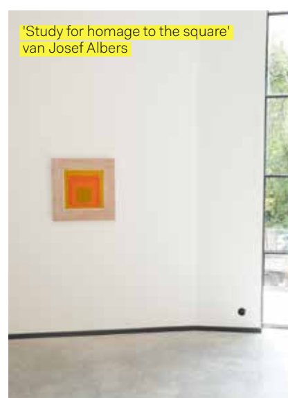
'Study for homage to the square' van Josef Albers