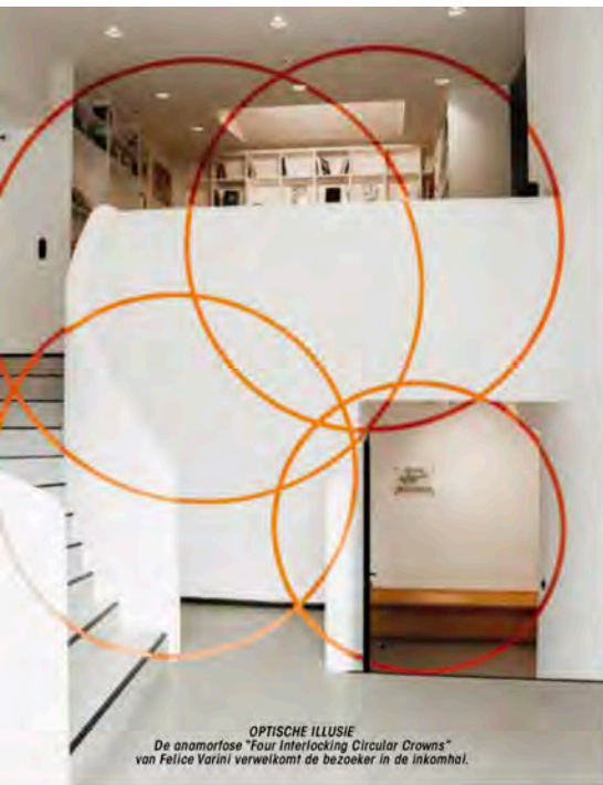
OPTISCHE ILLUSIE De anamorfose "Four Interlocking Circular Crowns" van Felice Varini verwelkomt de bezoeker in de inkomhal.