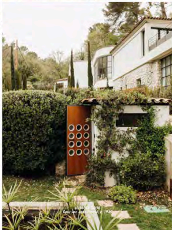
HUIDLOOS GEDRAG Daur van Janssens, 1949

“Minimale EN conceptuele KUNST ZIJN HET TEGENOVERGESTELDE VAN HET instantane. DE WERKEN DIE IN DE STICHTING WORDEN TENTOONGESTELD, NODIGEN ONS UIT DE TIJD TE NEMEN OM TE OBSERVEREN, TE overdenken, TE dromen EN TE INTERPRETEREN WAT WE ZIEN EN VOELEN.”