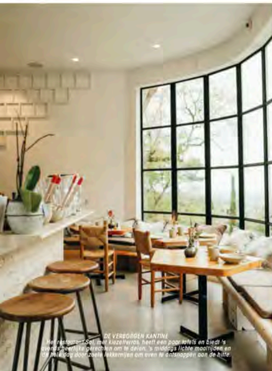
DE VERBORGEN KANTINE Het restaurant-Sol met kasselerade heeft een paar tafels en biedt 's avonds heerlijk gerechten om te delen. 's Middags lichte maaltijden en de hele dag door zoete lekkernijen om even te ontspannen aan de hifre.