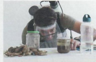
Asad Raza, Absorption , courtesy West Den Haag